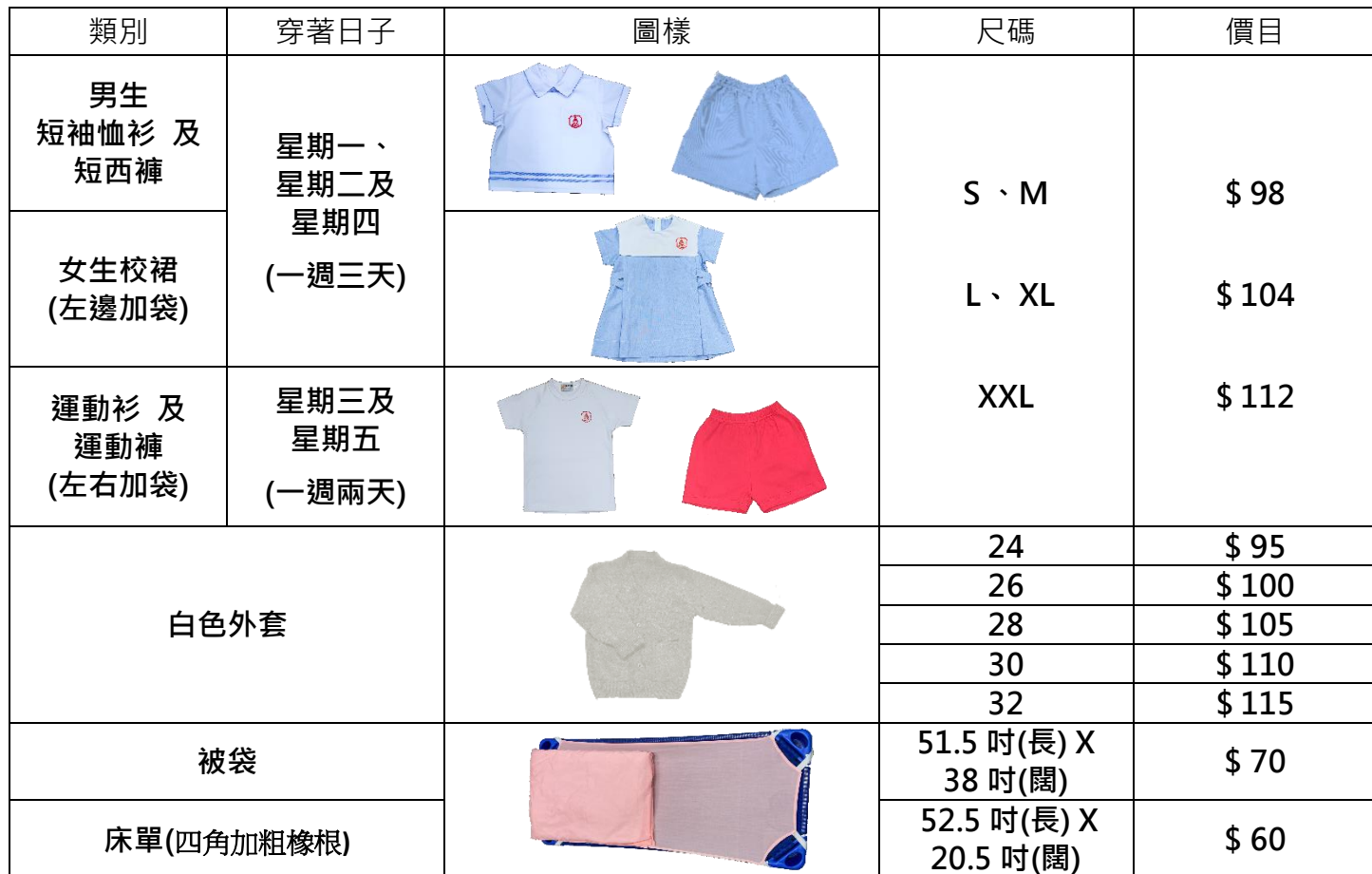
藍如溪盛成皿教育基金邊陳之娟幼兒稚園 2023-2024 年度夏季校服價目表